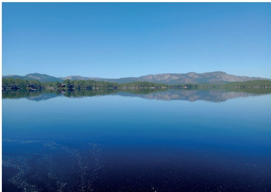
Sommarstemning på Tjørull